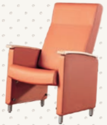
THERA-GLIDE® OASIS STATIONNAIRE