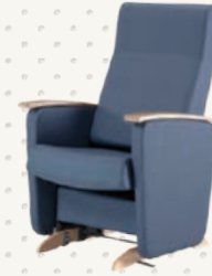
THERA-GLIDE® OASIS BERÇANT