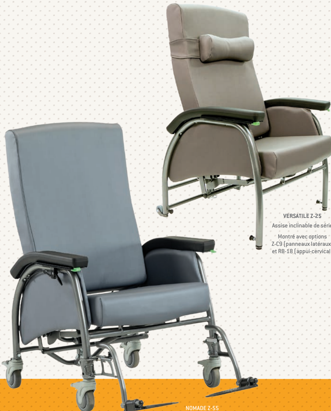
VERSATILE Z-25 Assise inclinable de série Montré avec options Z-C9 (panneaux latéraux) et RB-18 (appui-cervical)