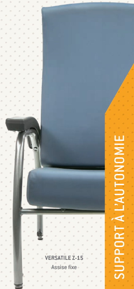
VERSATILE Z-15 Assise fixe