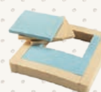
COUSSIN PRÉ-CURE® PRO